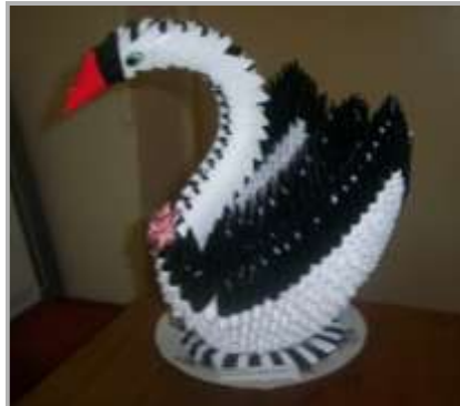
Оригами «Лебедь» Черных В.П.