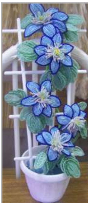
Плетение из бисера «Букет» Мельниковой О.С.