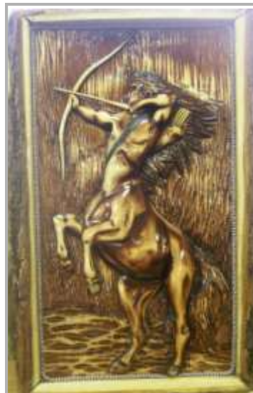
Резьба по дереву «Кентавр» Самойлюка С.Т.