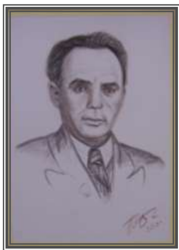
Живопись «Портрет С.Б. Вартазаряна» Беликовой Т.Н.